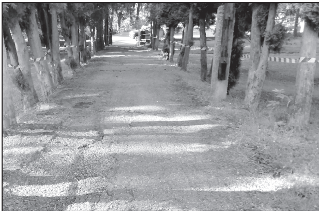
Prístupový chodník pred budovou základnej školy pred rekonštrukciou a po rekonštrukcii