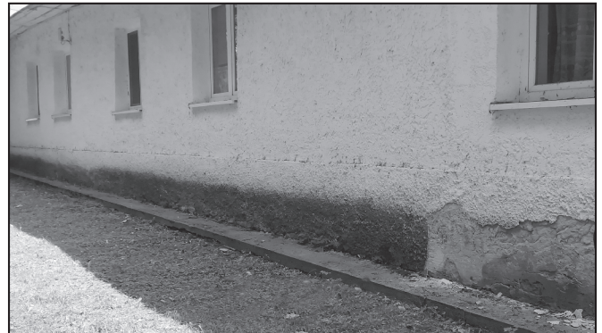
Pohľad na budovu materskej školy pred rekonštrukciou sokla a po rekonštrukcii